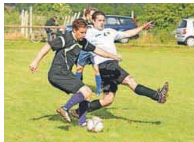
Akcija / FOTO: TINA DOKL