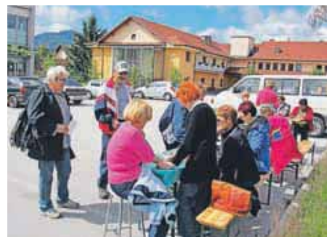
VSAKEMU UDELEŽENCU SO NAJPREJ IZMERILI KRVNI TLAK.