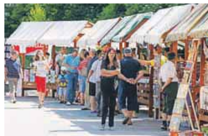
Stojnice v Naklem, Podbrezjah in v Dupljah so bile odlična priložnost za predstavitev domačih obrtnikov, društev...