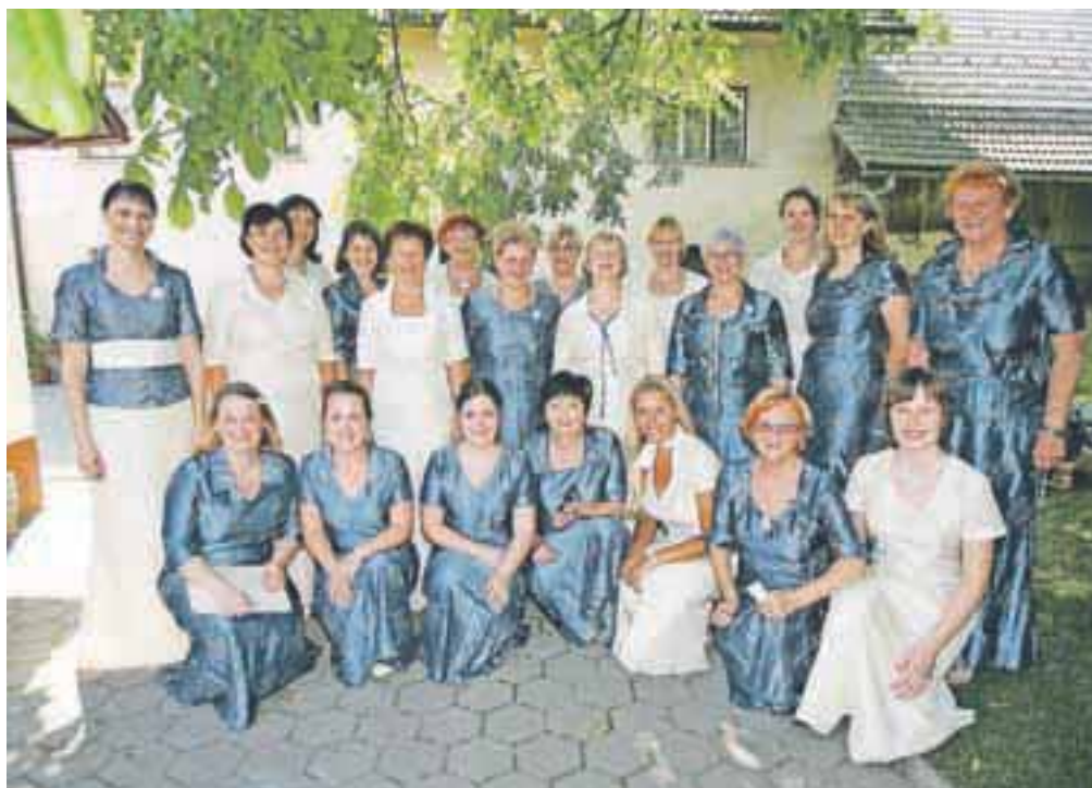
Ženski pevski zbor Dupljanke