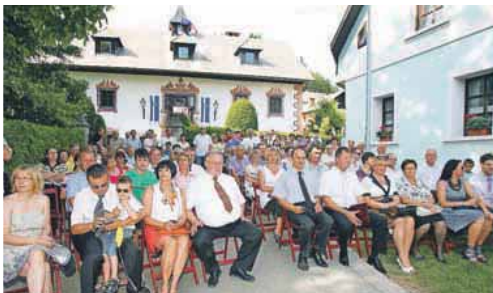
Slavnostna seja občinskega sveta občine Naklo pred graščino Duplje z gosti