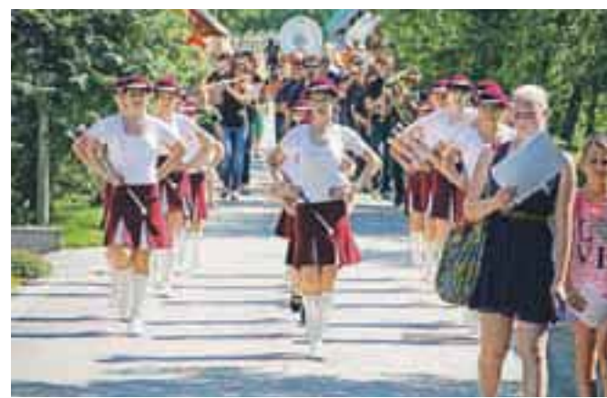
Mažoretke so spremljale godbo na pihala tik pred začetkom slavnostne seje v Dupljah.