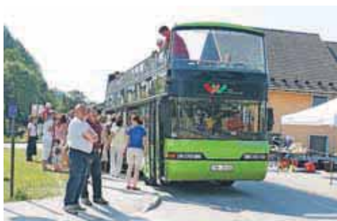
Panoramski avtobus Veseli Janez je s krožno vožnjo povezal kraje v občini Naklo.