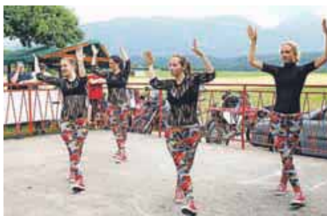
V Podbrezjah je bilo veselo pri gasilskem domu. Nastopila so tudi dekleta iz Plesnega studia Špela.